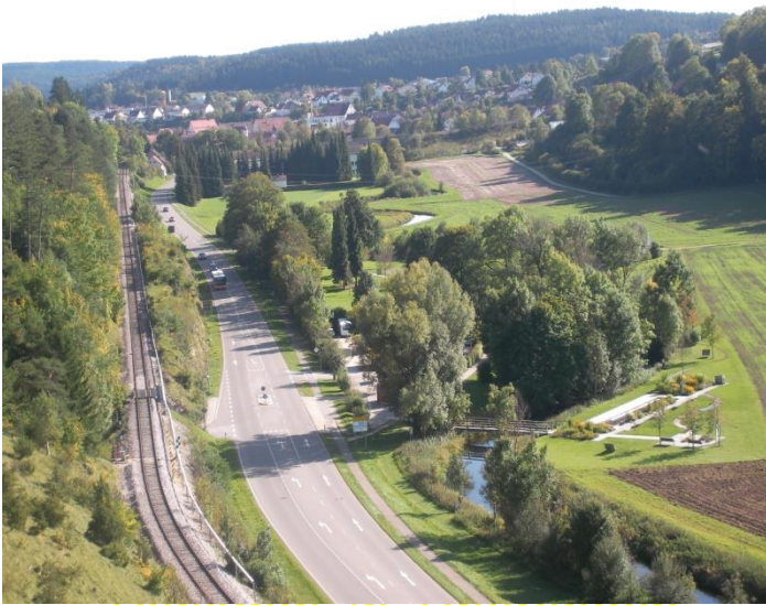
Denkmal in Überlingen

Treffpunkt: Bahnhof Sigmaringen um 12:00 Uhr